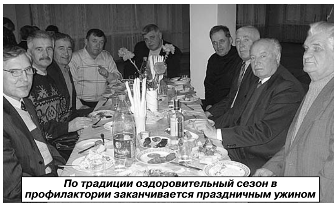
По традиции оздоровительный сезон в профилактории заканчивается праздничным ужином