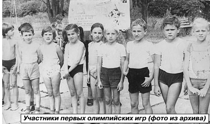
Участники первых олимпийских игр

Родилась эта традиция 40 лет назад, летом 1967 г., когда